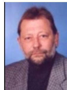
Turn – Sportwart: